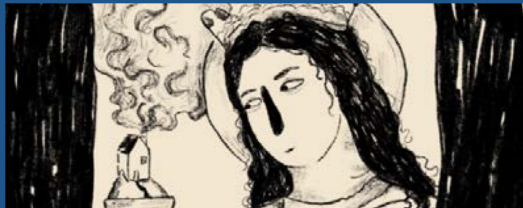
Illustration © Lisa Debeerst

* 21 h Clôture La Nuit des béguines , avec Áron Birtalan et Konijnen zijn ook mensen (Lisa Debeerst) en collaboration avec les habitants du Béguinage de Courtrai. La Nuit des béguines pratique la collectivité temporelle dans une procession festive, entre rituel quotidien, performance et lieu de rencontre.